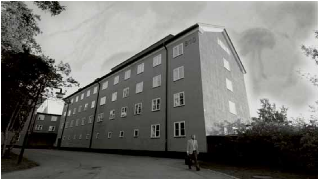
1/ (Vi) Caught, Dreaming, Rasmus Albertsen