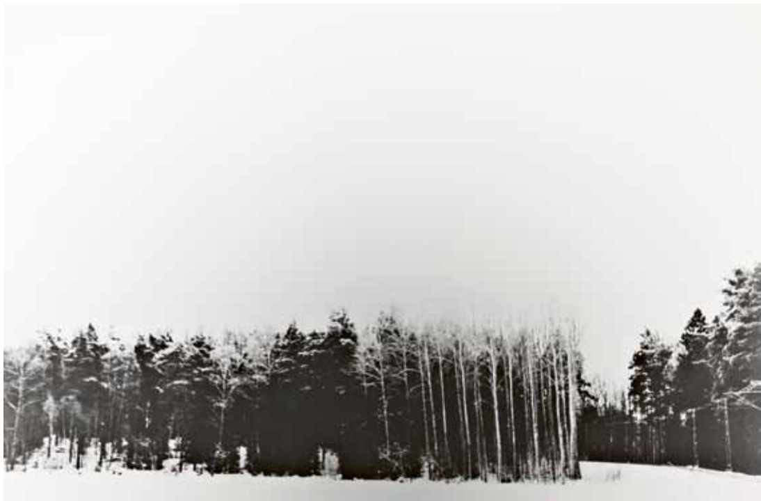
54/ (F) Landskab, Søren Rønholt *