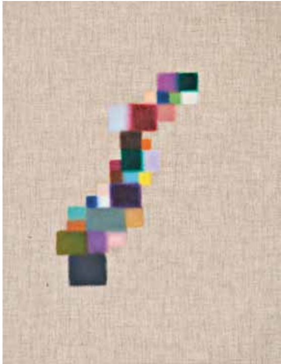
7/ (M) Uden titel, Line Busch *