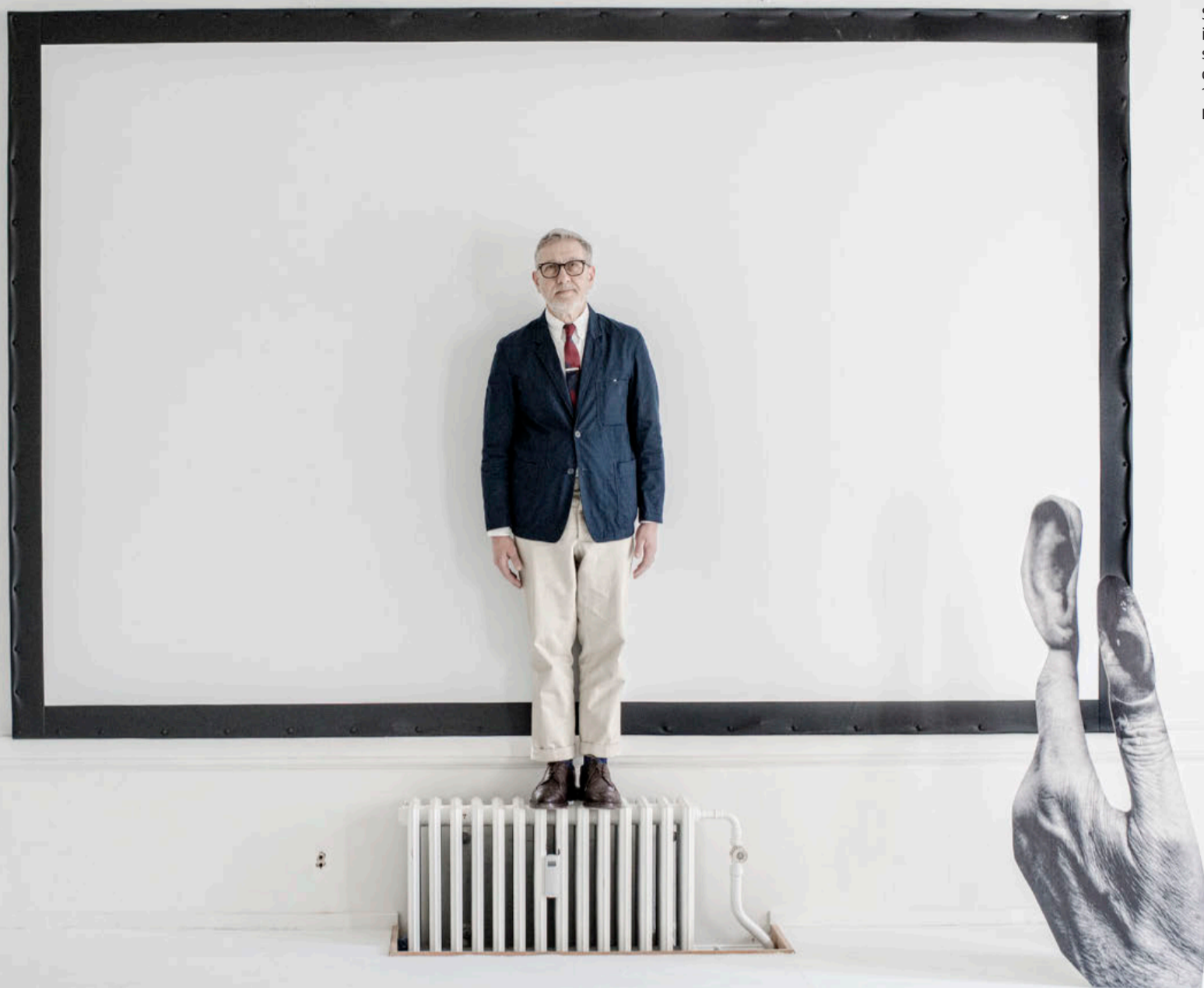
Sergei Sviatchenko er internationalt anerkendt som en af verdens førende collagekunstnere. Siden 1990 har han boet i Viborg.